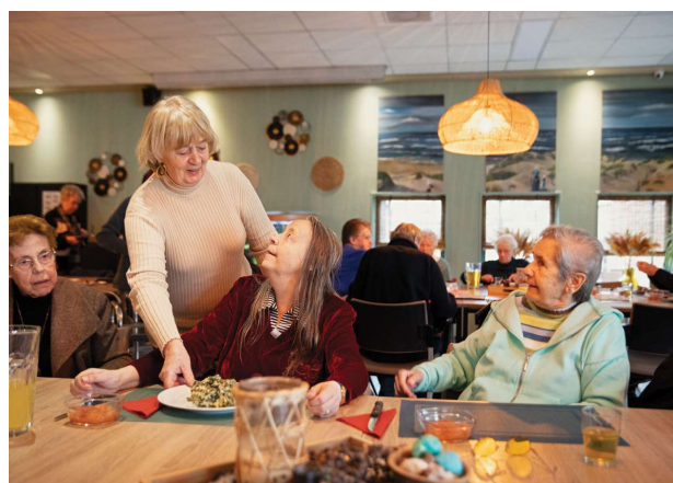
Maaltijdproject in het Trefpunt