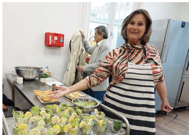
Schevenings ontmoeten in de Mallemok

Voedselbankwinkel Welzijn Scheveningen zamelt op 14 en 15 maart in bij verschillende supermarkten op Scheveningen. Vind je het leuk om hier op één van deze dagen aan mee te doen, meld je dan aan bij: Edith Nuss: 06 - 50652414